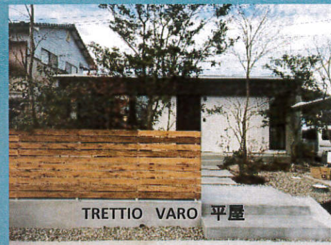
TRETTIO VARO 平屋